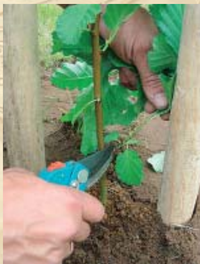
“Arboristu projekts ir devis cerību Latvijas kokiem...”

Nacionālajā līmenī ar šo projektu ir radītas fundamentālas iestrādnes, lai pievērstu sabiedrības, arboristu un uzņēmumu uzmanību Eiropas un Latvijas praksei koku kopšanas jautājumos. Viens no iepriekš neplānotiem projekta sasniegumiem ir Dendrologu biedrībā izveidotā arboristu nodaļa, kas jau ir uzsākusi apvienot šīs nozares darbiniekus un uzņēmumus, kā arī pārraudzīt valstī procesus koku kopšanas jomā. Ir definētas arborista profesijas speciālistam nepieciešamās zināšanas un