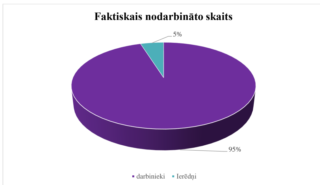
1. attēls. Nodarbināto skaits un sadalījums

2020. gadā VIAA kolektīvā darbu uzsāka 25 jauni nodarbinātie.