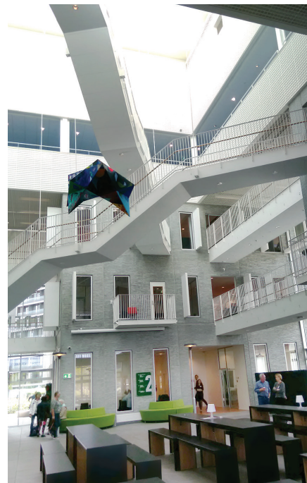
DDU semināra pirmās dienas norises vieta – ēka ar ieejām no visām četrām debespusēm un ar iespēju pāriet no viena stāva uz otru pa diagonālām kāpnēm

Par vienu no galvenajiem DDU ir izvirzījusi uzdevumu izveidot ciešu sadarbību ar darba devējiem, lai uzlabotu nodarbinātības jautājumu risināšanu,