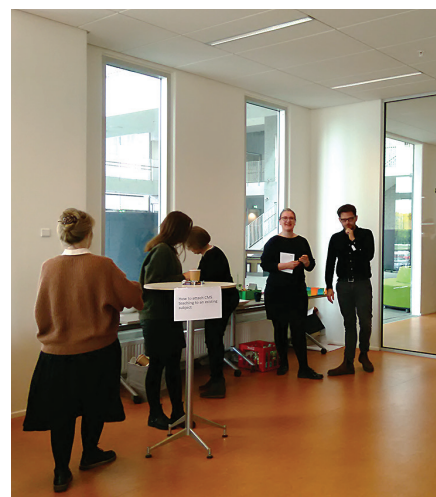
DDU semināra pirmās dienas „atvērtā dialoga laiks”

► Halmstades Universitātē (Zviedrija) tiek īstenota aktivitāte „Studijas universitātē, bet ko pēc tam?”. Tās ir „lielās brokastis”, kurās studenti uzklaua iedvesmojošus Halmstadē dzīvojošu absolventu karjeras pieredzes stāstus par dažādām uzņēmējdarbības jomām. Citā projektā „Halmstades sirds students”, Studentu savienībai sadarbojoties ar Halmstades pašvaldību, studentiem tiek rādīts, ka Halmstades pilsēta ir pievilcīga vieta darbam. ■