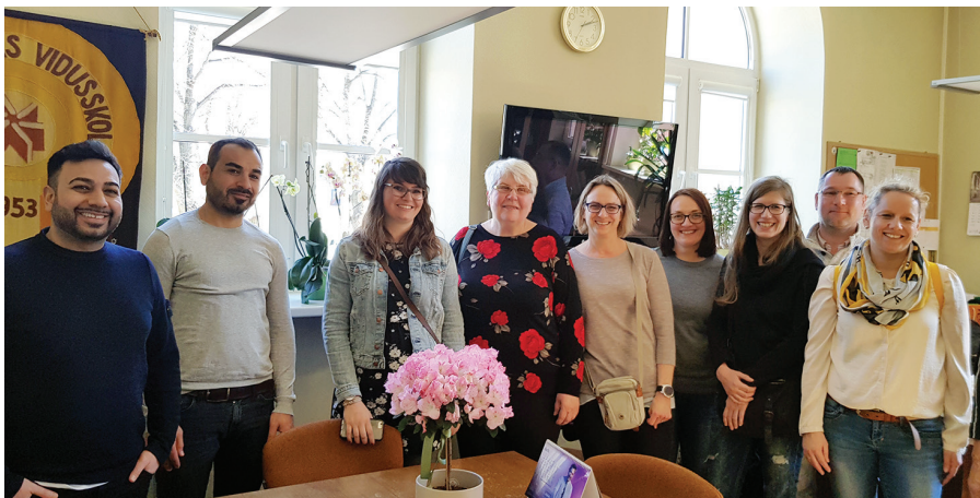
Academia dalībnieki viesojas Rīgas Teikas vidusskolā

Igaunijā profesionālās izglītības iestāžu uzņemšanas prasībās ir iekļautas zināšanas un pieredze. Jauniešiem ir jābūt pieredzei, palīdzot vecākiem vai kādam citam tajā profesijā, ko viņi vēlas apgūt skolā. Karjeras informācijas portāla „Rajaleidja” profesiju katalogā ( http://ametid.raialeidja.ee/Ametid ) ir iespējams pārbaudīt savas zināšanas par profesiju saturu, aizpildot testu.