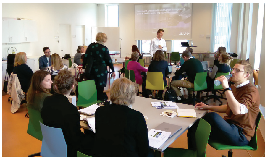
DDU semināra pirmās dienas lekcijas