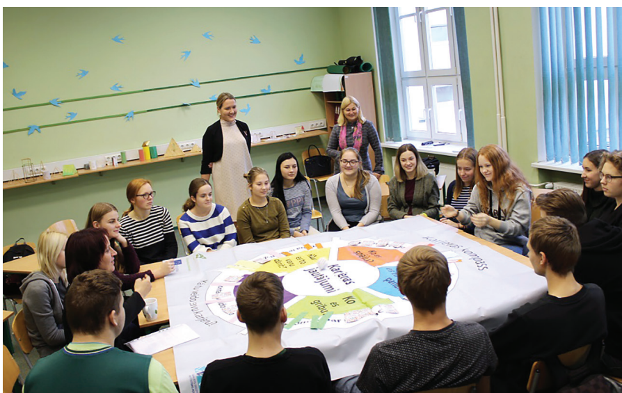
Karjeras kompas formulētie jautājumi raisa vidusskolēnu diskusijas par savām prasmēm, spējām, mērķiem

7.–9. klase – pusaudža gadi. Tiem raksturīgas spējas pārmaiņas fiziskajā un psiholoģiskajā attīstībā un domāšanā. Tas ir aktīvs pašizziņas posms, kad pusaudzis meklē atbildes uz jautājumiem „kas es esmu?” un „ko es dzīvē gribu darīt?”. Atbildes uz šiem jautājumiem tiek meklētas ļoti daudzos aspektos – saistībā ar attiecībām, vērtībām, pieredzi, mērķiem, karjeru, pārliecību un pasaules uztveri kopumā. Pusaudzis mēdz svārstīties, mainīt plānus no dienas uz dienu, izvirzīt neskaidrus un nereālus mērķus, taču šajā posmā sāk veidoties cilvēka identitāte, profesionālas un noturīgas intereses, pašpaļāvība un nākotnes redzējums.