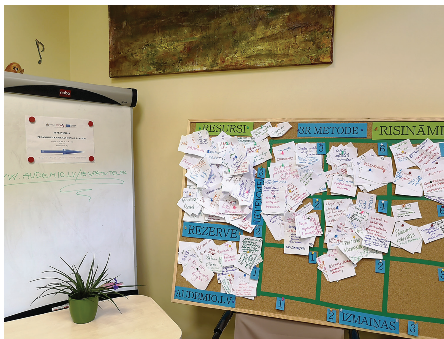
Pedagogu karjeras konsultantu aktivitāšu rezultāts supervīzijā