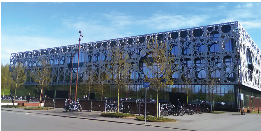
DDU inženierzinātņu programmu ēka

Dienviddānijas universitātē ir izveidots mentoru tīkls. DDU Nodarbinātības un karjeras centra vadītājs minēja pētījumu balstītu faktu, ka lielāks atalgojums ir tiem studentiem, kam studiju laikā ir bijuši vismaz trīs mentori. Par mentoriem var būt uzņēmēji vai organizāciju un uzņēmumu darbinieki. Arī pašiem studentiem tiek piedāvāts 2–5 gadus pēc studiju beigām kļūt par mentoriem. Šāds modelis relatīvi īsā laikā varētu apliecināt, vai obligāto KVP ieviešana universitātes studiju programmā ir efektīva vai neefektīva. Mentoru tīkls tiek uzskatīts par vienu no risinājumiem, kas sekmē studentu mācību motivāciju DDU. Sīkāk par katra piedāvājuma niansēm varēja uzzināt no DDU pārstāvjiem atvērtā dialoga laikā pirmās semināra dienas beigās.