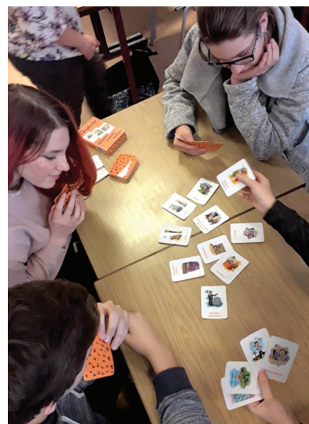
Formulēt savus mērķus un vērtības labi palīdz dažādas asociatīvās metodes

Mana pieredze. Vidusskolā jaunieši ir ļoti atvērti diskusijām, daudziem no viņiem jau ir pirmā darba pieredze, daži pēc skolas vai vasarā regulāri veic dažādus palīgdarbus. Jaunieši interesējas par to, kā izvirzīt mērķus, gūt panākumus un noteikt profesionālo piemērotību profesijai. Bieži pēc grupu nodarbībām jaunieši piesakās uz individuālajām konsultācijām, lai izvēlētos profesiju vai pārbaudītu savas spējas izvēlētajā jomā. Īpaši svarīga loma ir diskusijām par pārdomātu un izsvērtu izglītības izvēli un sagatavošanos studijām.