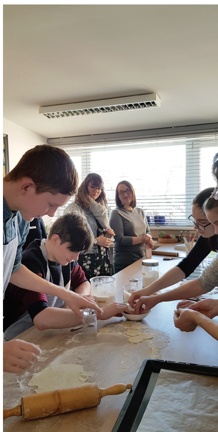
Nodarbības vērošana Rīgas 1. speciālajā internātpamatskolā – attīstības centrā

Ar ESF atbalstu Igaunijas Kvalifikāciju pārvalde ir izveidojusi vietni https://oska.kutsekoda.ee/en/ , kur var redzēt darba tirgus prognozes. Pašlaik Igaunijā trūkst IT speciālistu, ārstu un veco ļaužu aprūpētāju. Igaunijā ir arī īpaša vietne www.workinestonia.ee , kas aicina strādāt ārvalstniekus.