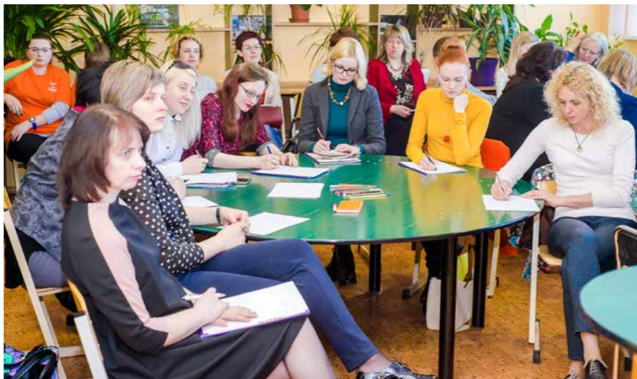
Pedagogi diskutē par karjeras vadības prasmēm

Kaut gan jēdziena definēšana nav tas būtiskākais, ir svarīgi izprast tā saturu, lai vienas jomas pārstāvji varētu kopīgi panākt noteiktu prasmju pilnveidošanu. Domāju, ka dažkārt ir vajadzīga arī profesionāla drosme atzīt savu neizpratni, nezināšanu, nedrošību, apmulsumu un neskaidrību. Ir vajadzīga drošumpēja, lai pārmaiņu laikos nepazaudētu mūžīgās dzīves pamatvērtības un, balstoties uz tām, pilnveidotu ikdienā nepieciešamās zināšanas un prasmes.