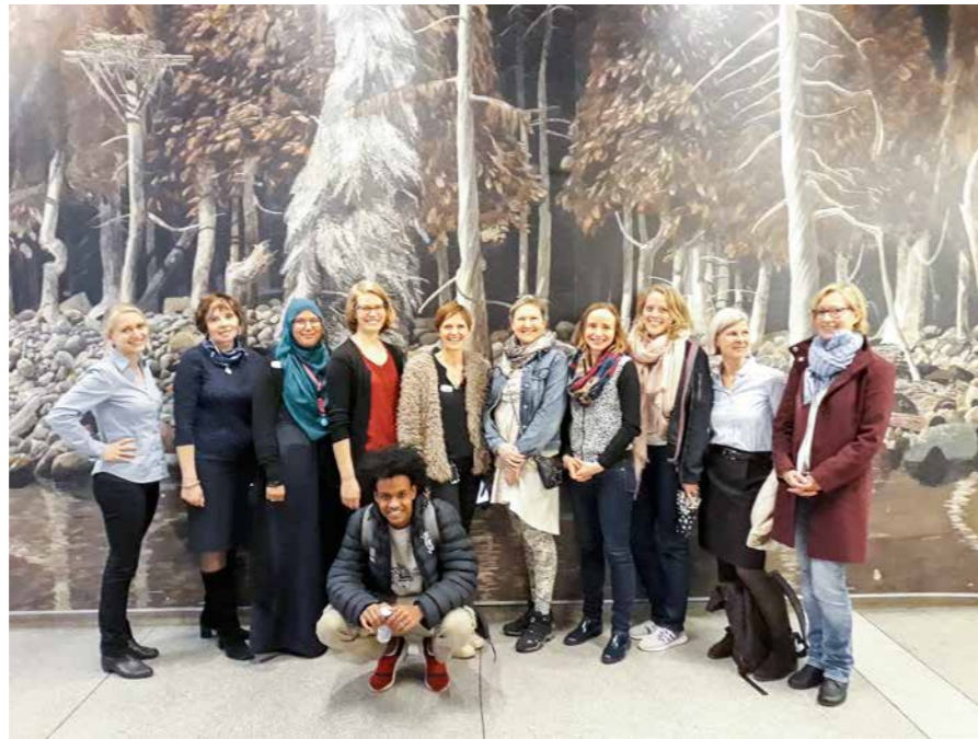
Karjeras konsultanti no Zviedrijas, Vācijas, Igaunijas un Latvijas tiekas Gēteborgā

Zviedrija, īpaši Gēteborga, ir daudzveidīga etniskajā un kultūras ziņā, tāpēc no kolēģiem bija iespēja rast atbildes uz dažādiem jautājumiem, piemēram, kā viņi risina zviedru valodas kā valsts valodas un otrās valodas, kā arī ma-