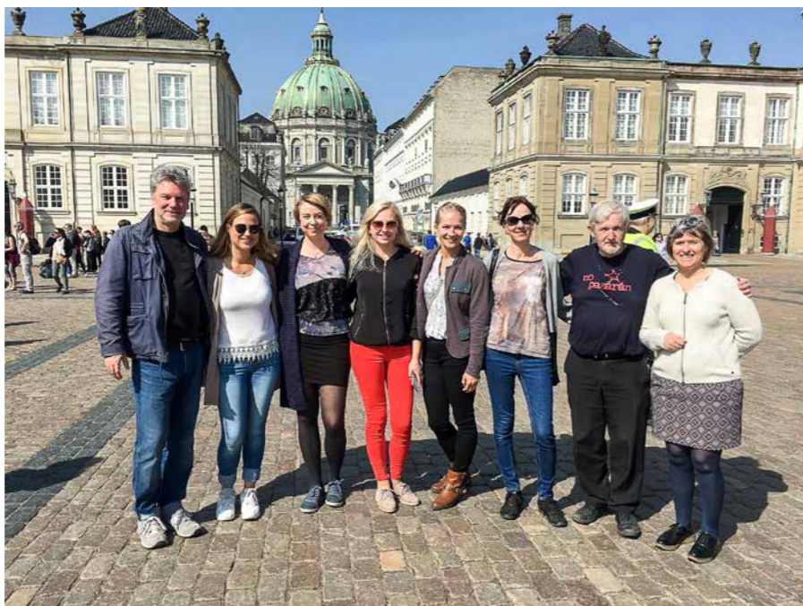
Academia starptautiskā karjeras konsultantu grupa viesojas Kopenhāgenā

Centrs rūpējas, lai visiem 15–17 gadus vecajiem jauniešiem būtu ar izglītību saistīts plāns. 8. klasē tiek novērtēta katra skolēna gatavība tālākai izglītības ieguvei pēc 9. vai 10. klases (10. klase ir papildu mācību gads pēc pašu izvēles pirms jaunatnes izglītības). Tiek vērtētas skolēnu akadēmiskās, personiskās un sociālās kompetences. Tiem skolēniem, kuri tālākai izglītības ieguvei nav gatavi,