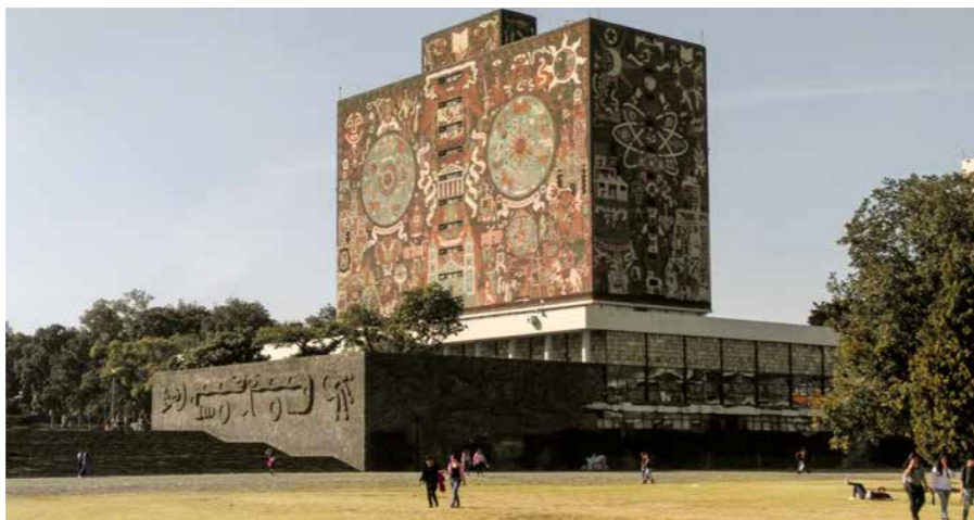
Meksikas Valsts universitātes galvenā ēka Mehiko