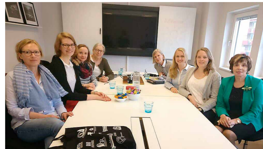
Karjeras konsultanti dalās pieredzē Gēteborgā

Gēteborgas Nodarbinātības aģentūrā tiek veikti pētījumi, lai noskaidrotu, kādi ir šī darba rezultāti. Pēdējā gada pētījums liecina, ka no tiem respondentiem, kuri pēc pamatskolas negribēja turpināt izglītības ieguvu, individuālā palīdzība ir bijusi sekmīga 90 % gadījumu. Protams, tas nav bijis viegls darbs. Vislielākās grūtības ir ar tiem pusaudžiem, kuri lieto narkotikas vai ir policijas uzskaitē kriminālu noziegumu dēļ.