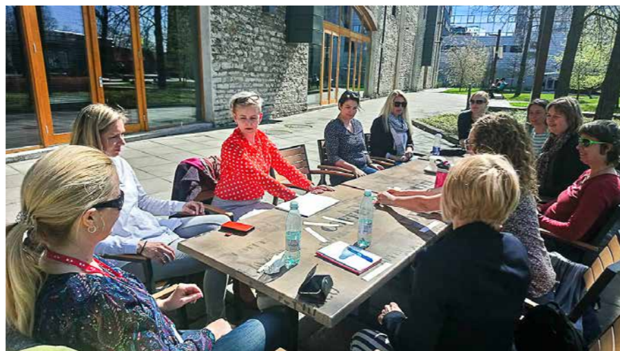
Karjeras konsultanti piedalās aktivitātēs par karjeras vadības prasmēm

2016./17. mācību gadā Igaunijā vispārējo izglītību ieguva 143 550 skolēnu, 25 000 mācījās profesionālajās skolās un 51 000 ieguva augstāko izglītību. Igaunijā nācīgas acīs izglītībai ir liela vērtība – tas ir labākais, ko valsts un ģimene bērniem var dot, lai viņi nākotnē būtu veiksmīgi. Ir izstrādāta "Igaunijas mūžizglītības stratēģija 2020", kas ir 20 lappušu gara un ir pieejama virtuālā formā. Tā ir tapusi, sadarbojoties Izglītības un zinātnes ministrijai un Sociālo lietu ministrijai. Stratēģijā uzsvērts: 1) uz skolēnu centrēta pieeja; 2) kompetenti un motivē-