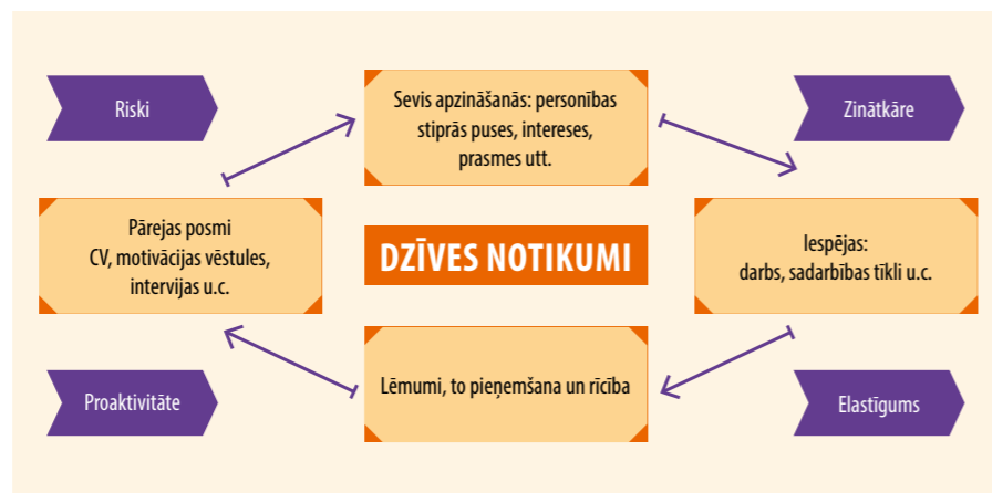
Karjeras attīstības DOTS modelis, kurā integrēti dažādi plānoti un nejauši dzīves notikumi