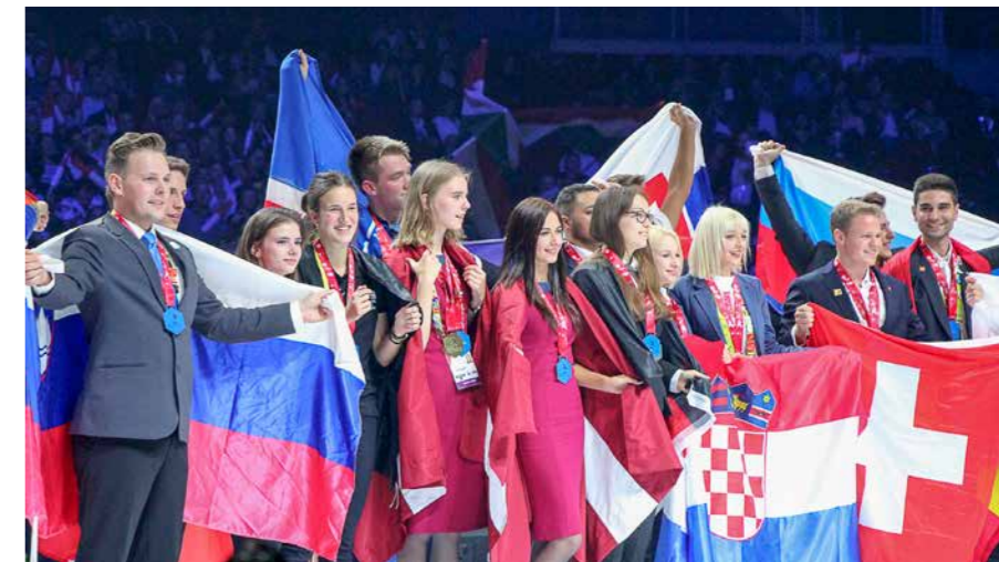
Konkursa EuroSkills 2018 nominācijas „Best of Nation” godalgotie konkursanti noslēguma ceremonijā Budapeštā