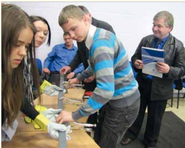
Jelgavas skolēnu komanda pilda vienu no piedāvātiem uzdevumiem

Šogad „ēnotāju” uzmanība bija pievērsta pašvaldības speciālistu