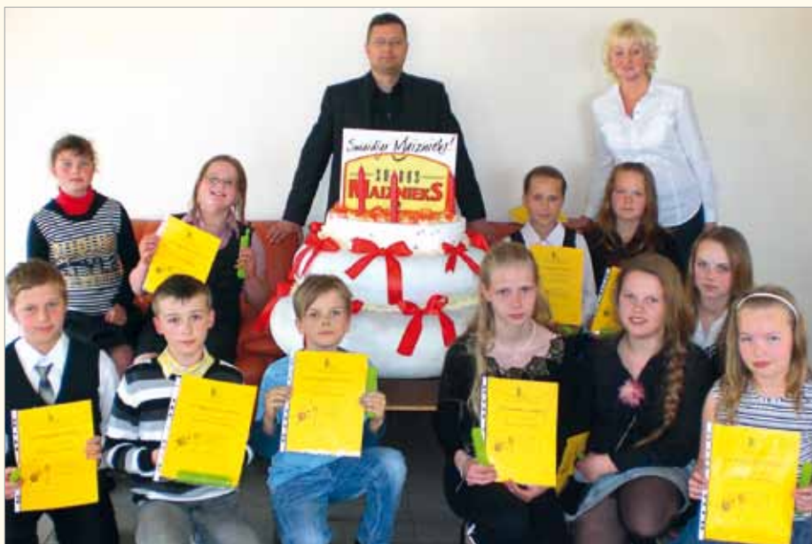
Jaunākie skolēni viesojas pie „Saldus maiznieka”

zinātniski pētniecisko darbu izstrāde un konkursi, un katru gadu apbalvo un godina uzvarētājus. Taču šogad Saldus Izglītības pārvaldē radās ideja organizēt uzvarētāju apbalvošanas pasākumu, kurā dalībnieki ne tikai gūtu gandarījumu par paveikto, bet galvenokārt arī papildu motivāciju turpmākai mērķtiecīgai darbībai un, protams, pašattīstībai. Tā kā karjeras izvēle un plānošana ir gan aktuāla, gan ļoti motivējoša tēma, tad par pasākuma galveno vadmotīvu kļuva divi vārdi: karjera un uzņēmība.