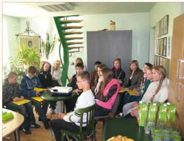
Saldus „Zaļā aptieka” iepazīstina skolēnus ar sava darba profilu

Šāda veida karjeras dienas veido jauniešos panākumu sajūtu, viņi iemācās būt noderīgi, izvirzīt un sasniegt mērķi, apzinoties, kādi resursi ir nepieciešami, lai atrastu savu unikālo personīgo piederību.