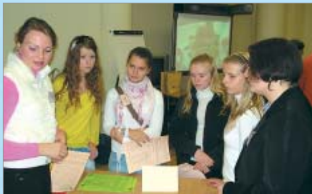
Skolēni izzina pašizpētes testus NVA Atvērto durvju dienā

Intervijas ar informācijas tehnoloģiju, finanšu, celtniecības, medicīnas nozaru pārstāvjiem, ko gatavojam sadarbībā ar biedrību „Jauniešu konsultācijas”, rosina ieskatīties NVA mājaslapā ( www.nva.gov.lv , sadaļa „Karjeras pakalpojumi”), lai iegūtu papildu