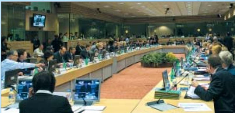
Izglītības un zinātnes ministre T. Koķe (fotogrāfijas centrā) ar ES kolēģiem, diskutējot par mūžizglītības sistēmas attīstību Eiropā

21. novembrī izglītības un zinātnes ministre Tatjana Koķe piedalījās Eiropas Savienības (ES) Izglītības, jaunatnes un kultūras ministru padomē Briselē, kurā uzrunāja ES valstu ministrus par Mūžizglītības sistēmu Latvijā un Eiropā.