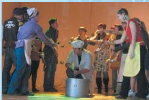
Valmieras Pārgaujas ģimnāzijas skolēni Karjeras vakarā rāda skeču par pavāra profesiju

Manuprāt, būtiskākā pilnveidojamā lieta ir sabiedriskās domas virzība – ne tikai skolotāju, vecāku, pašvaldības pārstāvju ieinteresēšana, bet arī izglītošana šajos jautājumos. Svarīgi, lai karjeras izglītībā iesaistītie saprastu pasaules mainību, nepieciešamību laikus