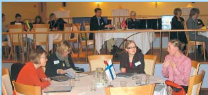
Semināra dalībnieki, meklējot risinājumus starpkultūru barjeru pārvarēšanai

Darba gaitā bija plānots identificēt starpkultūru barjeras, kas eksistē izglītībā un nodarbinātībā, un meklēt risinājumus tam, kā tās pārvarēt Baltijas-