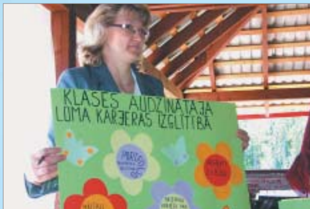
Izglītojošajā seminārā Alūksnes rajona vispārīgā skolu skolotājiem dalībiece noslēguma pasākumā prezentē klases audzinātāja lomu karjeras izglītībā

Lai veicinātu kvalitatīvu jaunizstrādātās programmas apguvi un sadarbību starp tās īstenotājiem, projekta pagarinājumā iecerēts arī izveidot studiju programmas e-mācību vidi.