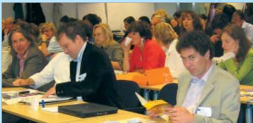
Vienota karjeras atbalsta politikas tīkla izveidē iesaistītie eksperti un speciālisti Slovēnijas konferencē

28 Eiropas valstis, tai skaitā arī Latvija, ar izglītību saistītas ES organizācijas (CEDEFOP, ETF), starptautiskās asociācijas (PES, FEDORA), informācijas un karjeras konsultāciju tīkls Euroguidance , Eiropas starptautiski atzītie eksperti karjeras vadības un konsultāciju jautājumos iesaistījušies kopīga projekta īstenošanā Eiropas Mūžilgas karjeras atbalsta politikas tīkla (EMKAPT) izveidei. Projektu atbalsta Eiropas Komisija.