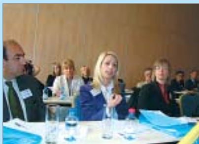
Valstu pārstāvji Prāgas seminārā

Seminārs bija noorganizēts, lai kopīgi aplūkotu aktuālās tendences Eiropas valstu karjeras attīstības atbalsta īstenošanā un politikas veidošanā mūžizglītības kontekstā, identificētu sasniegumus un trūkumus, kā arī vienotos par prioritātēm kopēju sasniedzamo mērķu izvirzīšanai.