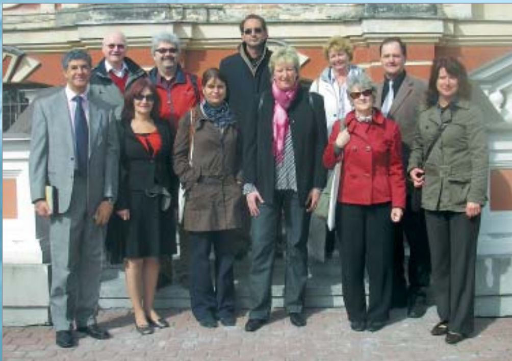
Studiju vizītes dalībnieki pēc iepazīšanās ar karjeras konsultanta izglītības programmu Latvijas Lauksaimniecības universitātē

Ārvalstu viesiem bija iespēja ne tikai iepazīt Latvijas izglītības sistēmu, bet arī dalīties savā pieredzē. Kā rezultātā ikviens guva secinājumu, ka gan Latvijā, gan citās Eiropas valstīs ir daudzas kopīgas problēmas, piemēram, kvalificētu lektoru piesaistišana pieaugušo izglītības kursiem, līdzekļu piesaistišana darbības nodrošināšanai un vēl nepietiekami plaši pieejami karjeras atbalsta pakalpojumi pieaugušajiem mūžizglītības veicināšanai. Vizītes dalībnieki apņēmas turpināt sadarbību un atbalstīt viens otru projektu veidošanā šo izaicinājumu īstenošanai.