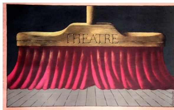
Jura Dimitera plakāts „Theatre” (1985).

To veidoja Džemmas Skulmes māte (mamma) .