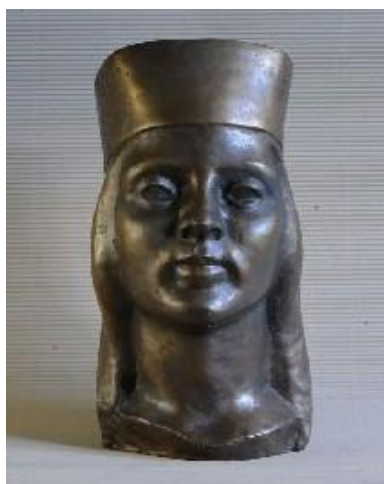
Martas Skulmes (Liepiņas) skulptūra „Vainagā” (1939).

Tajā ir Džemmas Skulmes meita un mazdēls .