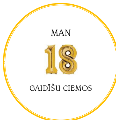
Dzimšanas diena, C