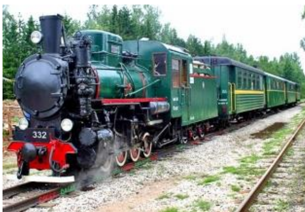
Alūksnes – Gulbenes bānītis

Ieraksti vietnes You tube meklētājā vārdus avārijas brigāde un skaties animācijas filmas “Avārijas brigāde”!