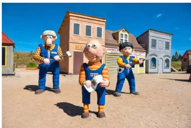
Izklaides parks „Avārijas brigāde”