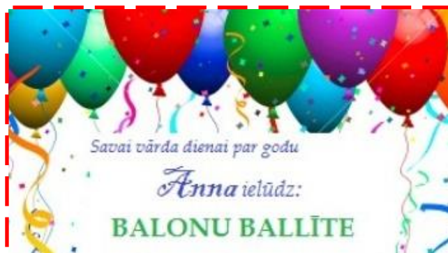
Vārda diena, A