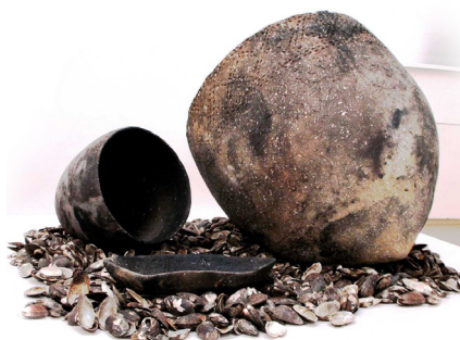
Narvas kultūras pods