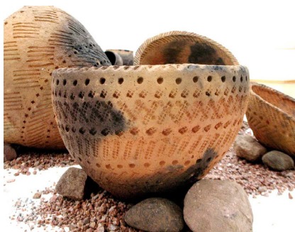
Ķemmes bedrīšu kultūras keramika