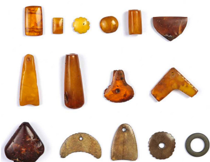
Dzintara, kaula un akmens piekariņi