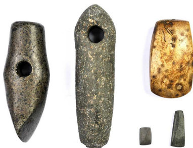
Akmens laivas veida cirvis un kaplis