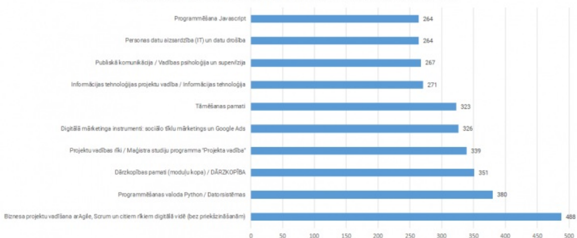
Pieprasītākās izglītības programmas pēc apstiprinātā pieteikumu skaita attālinātā kartā

Attālināto mācību kārtā pieaugušie pirmo reizi studiju kursus vai studiju moduljus varēs apgūt arī koledžā vai augstskolā. Augstākās izglītības iestāžu vidū vislielāko pieteikumu skaitu ir saņēmusi Biznesa augstskola Turība (3 082 iedzīvotāju pieteikumi 33 izglītības programmās) un Rīgas Tehniskā universitāte (2 229 iedzīvotāju pieteikumi 17 izglītības programmās).